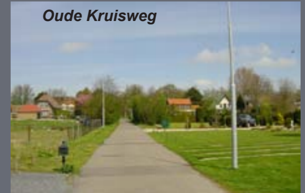
golfbaan op ca. 1 km