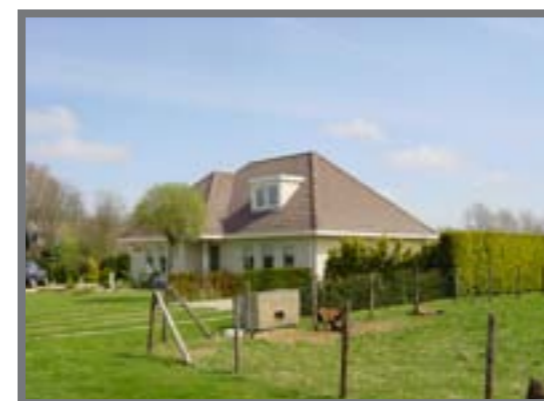
Oude Kruisweg 192 e