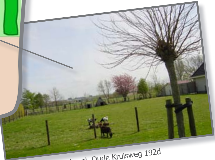
De kavel, Oude Kruisweg 192d