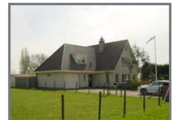
Oude Kruisweg 192 c